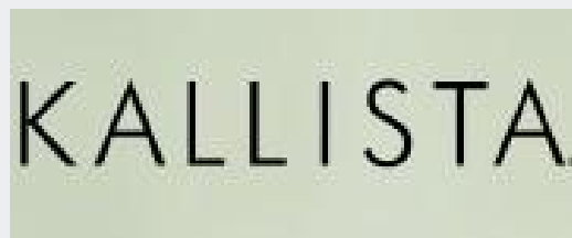
卡利斯塔-科勒 美国